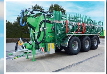
30 m Gestänge schnell verfügbar