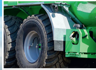
Pumpen mit hohem Durchfluss (Zentrifugal- und Vakuumpumpe) mit Durchflussmesser